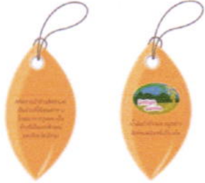
ด้านหน้า