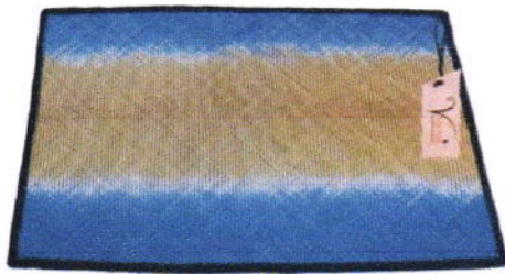
ผลิตภัณฑ์กระจูด