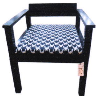
ผลิตภัณฑ์กระจูด