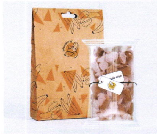
Idea : Logo / Product / Package

โครงการชุมชนท่องเที่ยว OTOP นวัตวิถี จังหวัดพัทลุง ภายใต้ความสนับสนุน-ระหว่างสำนักงานพัฒนาชุมชนจังหวัดพัทลุง และมหาวิทยาลัยทักษิณ