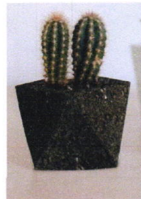
Idea : Logo / Product / Package

โครงการชุมชนท่องเที่ยว OTOP นวัตวิถี จังหวัดพัทลุง ภายใต้ความร่วมมือระหว่างสำนักงานพัฒนาชุมชนจังหวัดพัทลุง และมหาวิทยาลัยทักษิณ