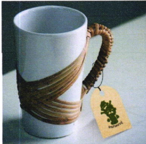
Idea : Logo / Product / Package

โครงการชุมชนท่องเที่ยว OTOP นวัตวิถี จังหวัดพัทลุง ภายใต้ความร่วมมือระหว่างสำนักงานพัฒนาชุมชนจังหวัดพัทลุง และมหาวิทยาลัยทักษิณ