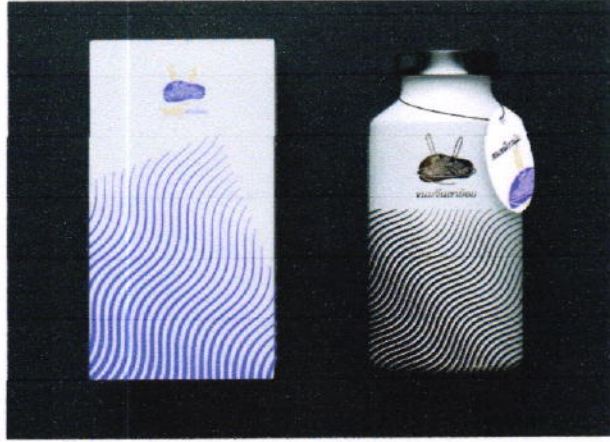
Idea : Logo / Product / Package

โครงการชุมชนท่องเที่ยว OTOP นวัตวิถี จังหวัดพัทลุง ภายใต้ความร่วมมือระหว่างสำนักงานพัฒนาชุมชนจังหวัดพัทลุง และมหาวิทยาลัยทักษิณ