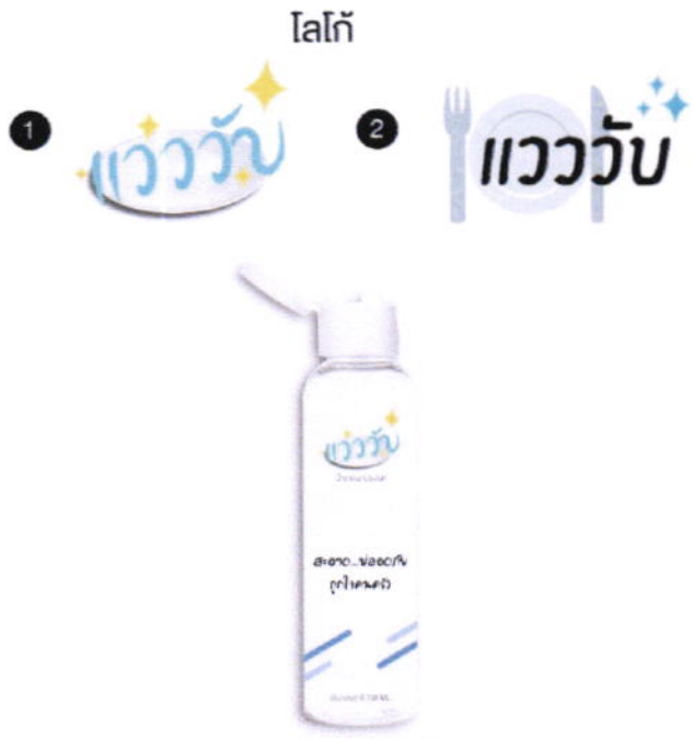
Idea : Logo / Package

โครงการชุมชนท่องเที่ยว OTOP นวัตวิถี จังหวัดพัทลุง ภายใต้ความร่วมมือระหว่างสำนักงานพัฒนาชุมชนจังหวัดพัทลุง และมหาวิทยาลัยทักษิณ