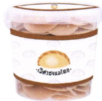
Idea : Logo / Product / Package

โครงการชุมชนท่องเที่ยว OTOP นวัตวิถี จังหวัดพัทลุง ภายใต้ความร่วมมือระหว่างสำนักงานพัฒนาชุมชนจังหวัดพัทลุง และมหาวิทยาลัยทักษิณ