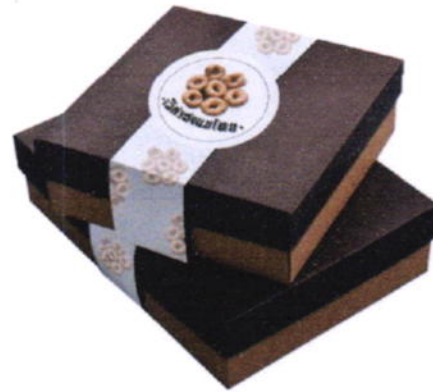
Idea : Logo / Product / Package

โครงการชุมชนท่องเที่ยว OTOP นวัตวิถี จังหวัดพัทลุง ภายใต้ความร่วมมือระหว่างสำนักงานพัฒนาชุมชนจังหวัดพัทลุง และมหาวิทยาลัยทักษิณ